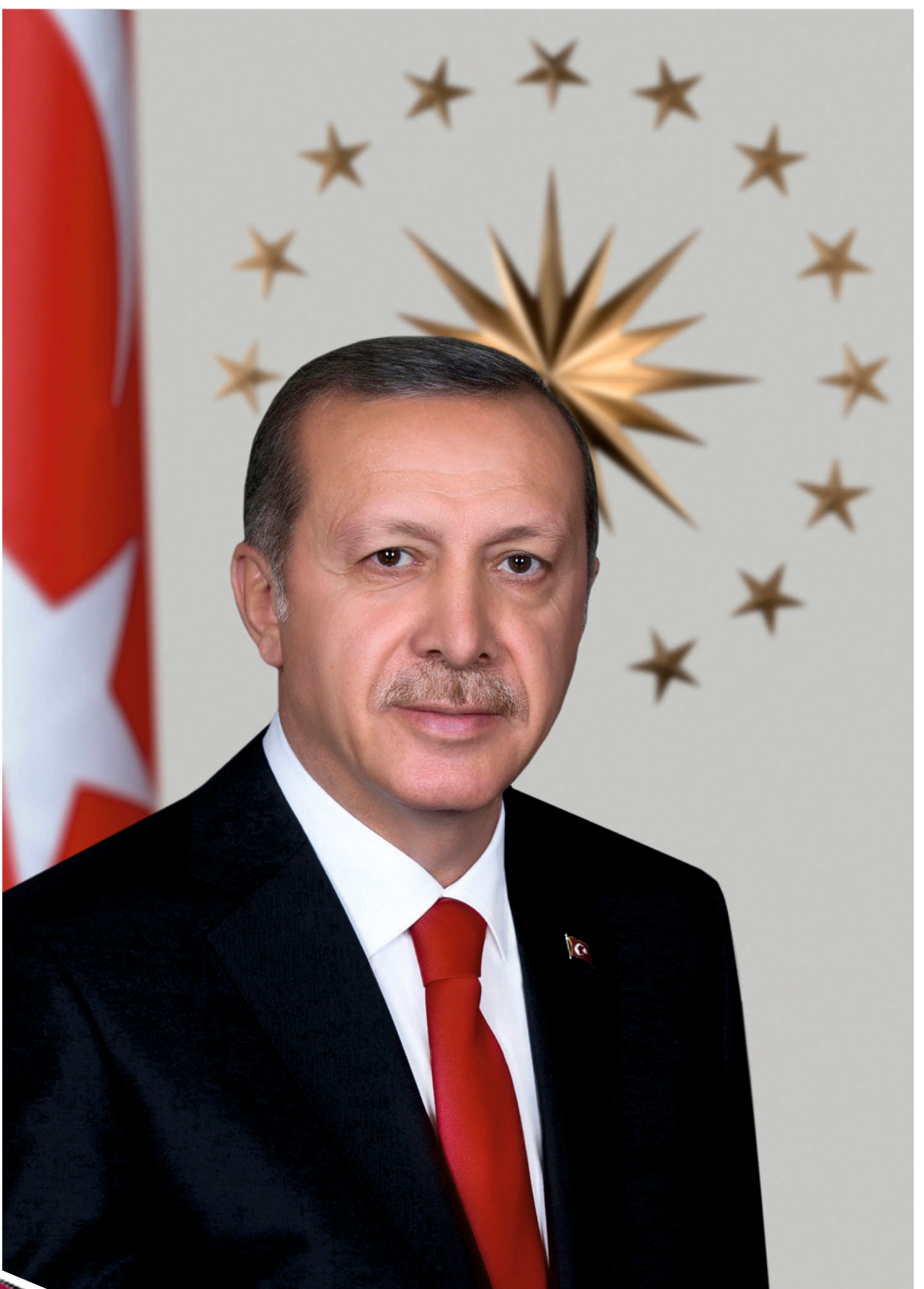
RECEP TAYYIP ERDOĞAN CUMHURBAŞKANI