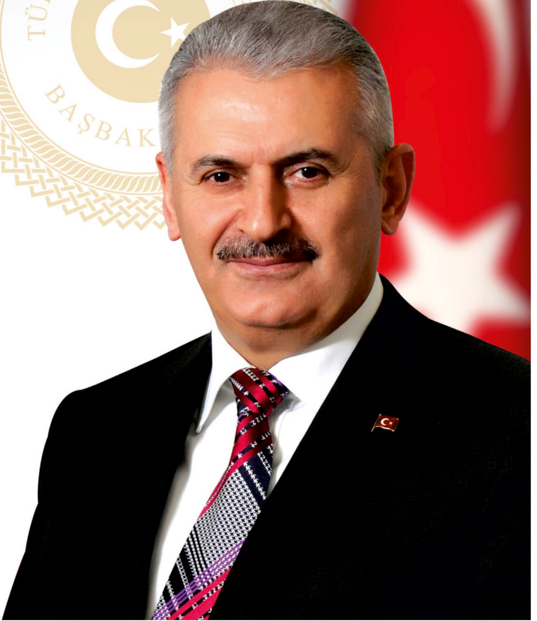
BİNALİ YILDIRIM BAŞBAKAN